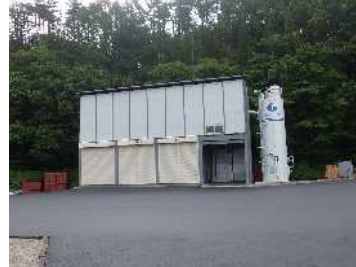
生コンの製造を行うバッチャープラントは既に稼働しています