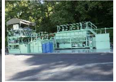
濁水処理プラントの設置も完了しました