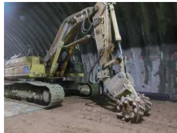
野底福島トンネルはこのツインヘッダーを用いて地山を削り掘削します（写真は別工事です）