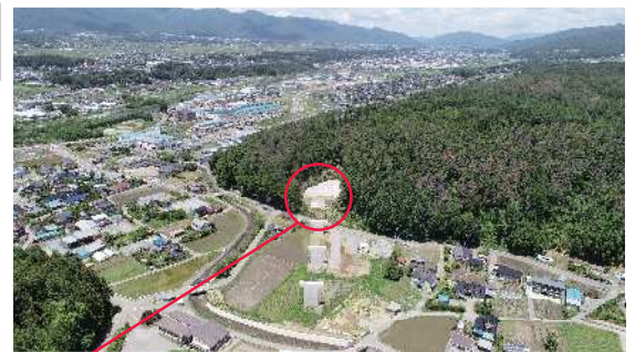
ここに抜けます。トンネルの出口は橋梁です。

このトンネルには幅員3.5mの車道2車線と幅員3.0mの広い歩道ができます。完成時にはとても大きな断面のトンネルとなります。なお、掘削中には現場見学会の機会を設けますので、ぜひご来場ください。