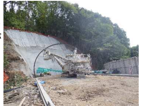
エレクター付コンクリート吹付機による坑口シェルター支保工設置状況

この度、地元説明会を8月22日に開催させて頂く運びとなりました。今後も安全を第一に作業を進めてまいりますのでよろしくお願い致します。