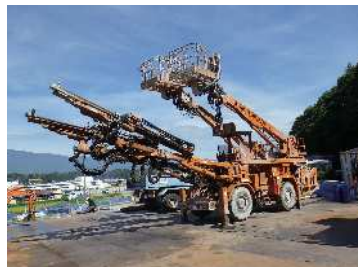
地山に穿孔を行うドリルジャンボも現場に到着しています